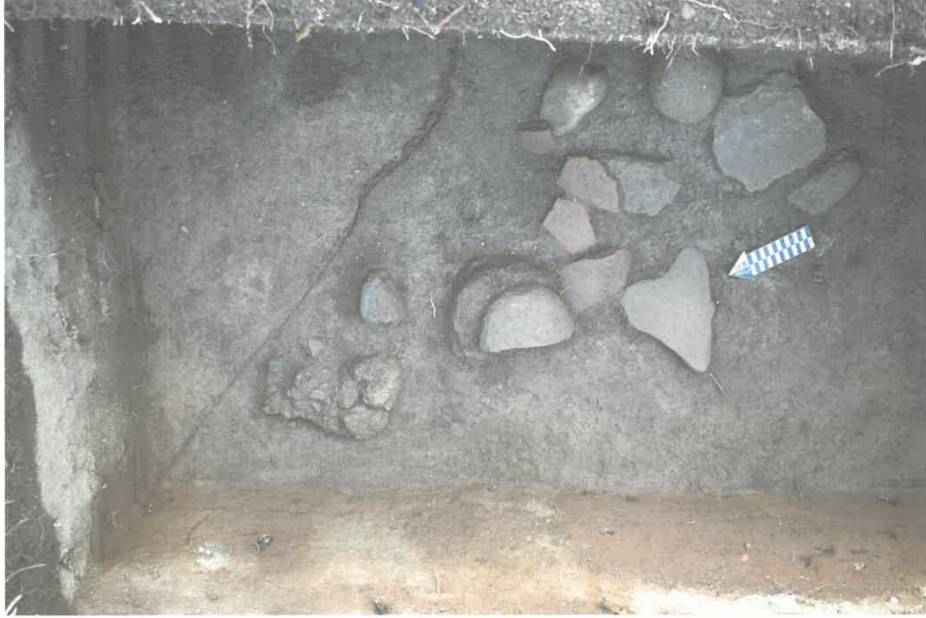
Figura 3. Fotografía del grupo de material arqueológico lote CC2a/7A (Parque Arqueológico Nacional Tak'alik Ab'aj, MICUDE-DGPCN/IDAEH 2021).